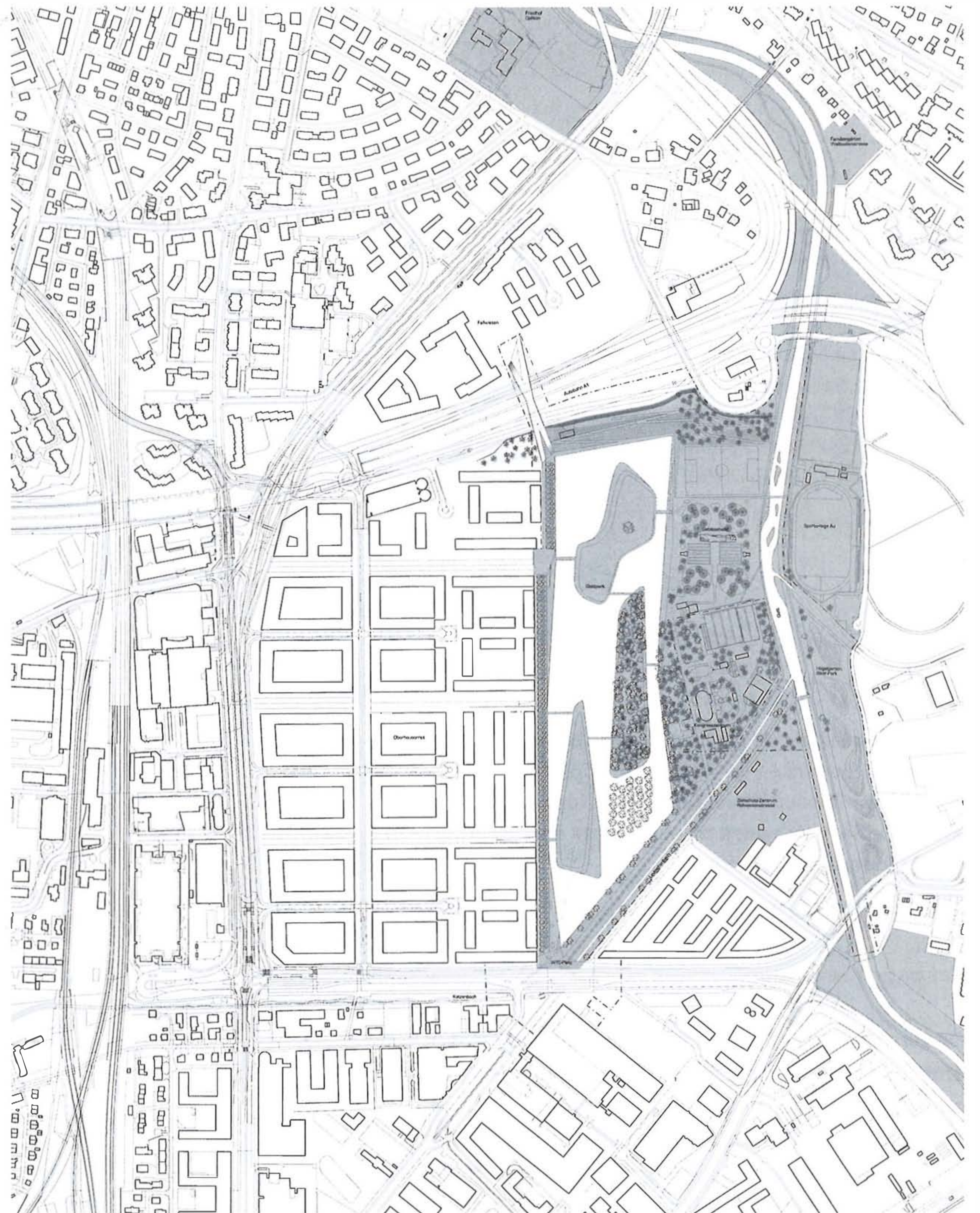
Pläne jeweils vom Projektverfasser

einem Park. Das ist eine Folge der Realpolitik solcher Gemeinden, die eher die Steuern senken als in öffentliche Anlagen mit städtischen Qualitäten zu investieren. Dies entspricht zudem auch stärker dem Selbstverständnis vieler Bewohner, die von «Stadt» ohnehin nichts wissen wollen. Was im Fall von Köniz immerhin gelang, ist die Sicherung des Grundstücks für kommende Einsichten. Andere Gemeinden verbauen ihre Allmenden und laufen Gefahr, sich zu parklosen Vorstädten zu entwickeln.